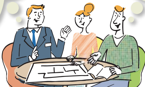
illustration © LIXIL + andesign. All Rights Reserved.